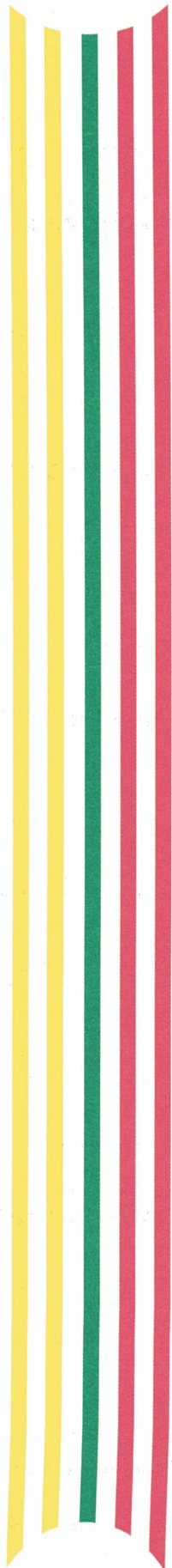
WANDERLEY RODRIGUES DE SOUZA